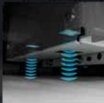
Rivelatore a ultrasuoni