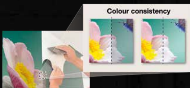
Uniformità dei colori