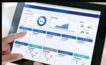
Epson Cloud Solution PORT

Le tre tecnologie di stampa Epson (Halftoning, LUT completamente ottimizzato e Micro Weave) consentono di ottenere immagini di alta qualità, riducendo la granulosità e le bande. La tecnologia di riscaldamento e polimerizzazione completamente controllata, unita alla testina di stampa PrecisionCore di lunga durata, garantisce un'uniformità dei colori affidabile per tutta la durata del ciclo di stampa. In tal modo si evita la necessità di ristampe a causa di colori non corrispondenti.